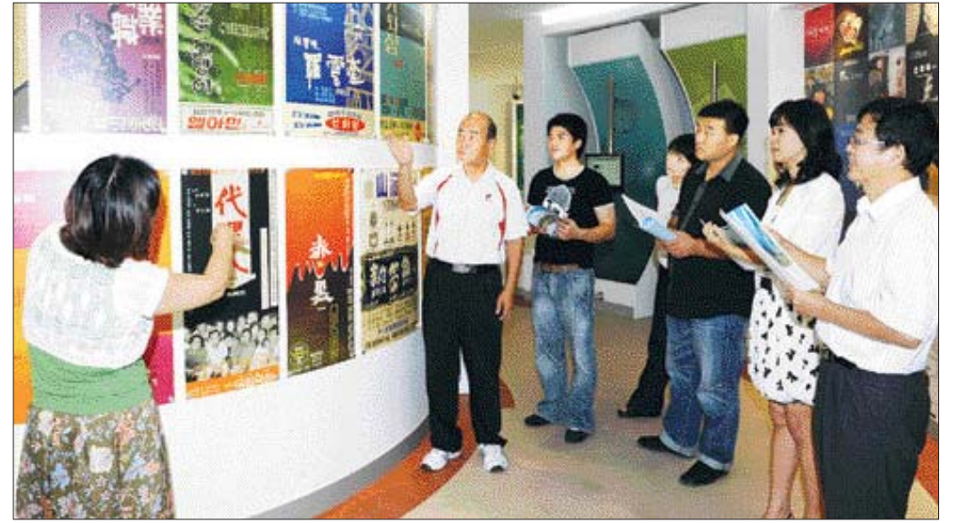
23일 오후 목포문학관에서 열린 ‘문학관 도슨트 양성교육’에서 목포문학관 홍보팀(맨 왼쪽) 학예연구사가 수강생들에게 전시유품에 대한 설명을 하고 있다.