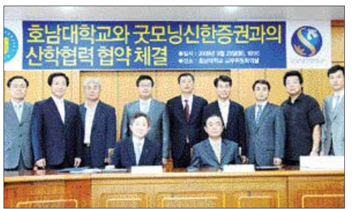
호남대는 지난 22일 광산캠퍼스 황룡관 회의실에서 굿모닝신한증권과 산·학 협약을 체결했다. 양 기관은 이날 협약식을 통해 금융 아카데미 개설, 취업 설명회 등 협력 사업을 추진기로 했다.