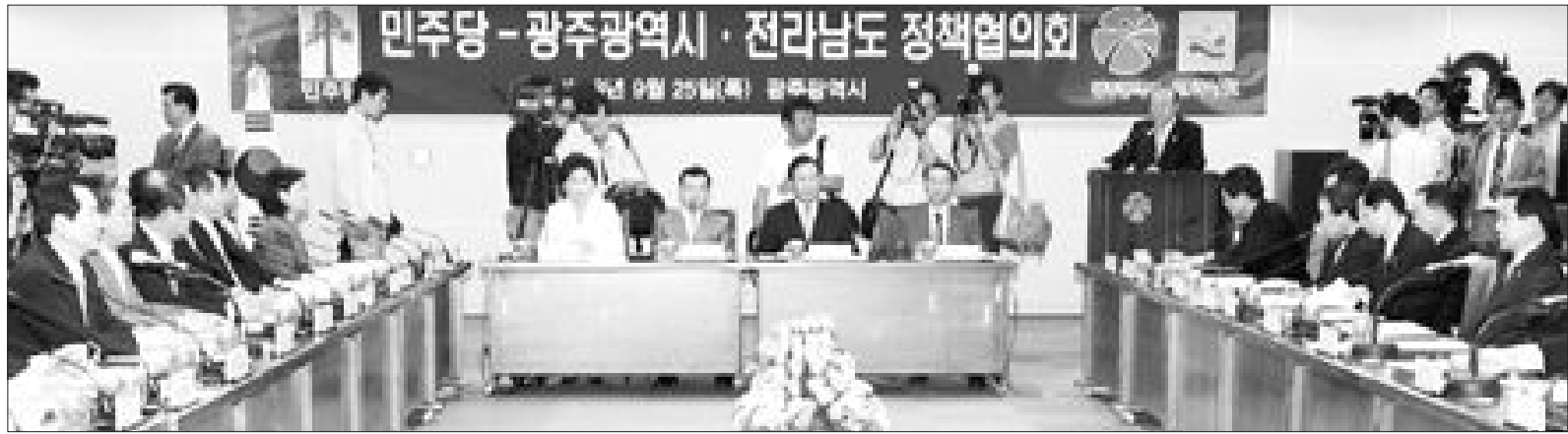
민주당과 광주·전남 정책협의회가 25일 광주시청 회의실에서 정세균 민주당 대표와 박주선·최인기 최고위원 등 민주당 지도부, 박광태 광주시장과 박준영 전남도지사 등이 참석한 가운데 열렸다.