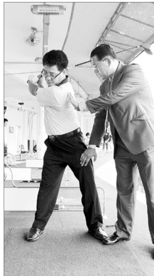
테이크 백에서 왼쪽 하체가 견고하게 버틴 상태에서 상체 회전이 발생해야 비거리를 늘릴 수 있다.