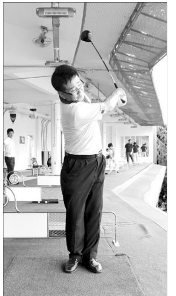
무릎을 모으고 하프스윙을 하게 되면 체중이동, 하체 고정과 상체의 꼬임을 정확하게 익힐 수 있다.