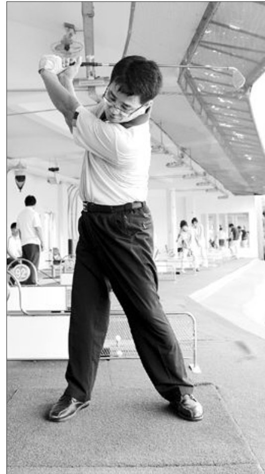
테이크 백에서 왼 어깨가 숙여져 상체가 접히는 잘못된 동작(왼쪽)과 왼쪽 어깨 턴이 된 잘못된 동작.