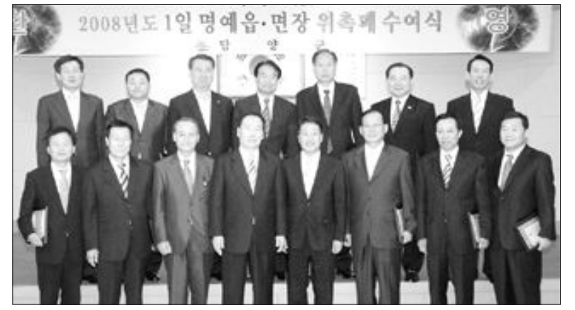
반영될 수 있도록 하고 기관·사회단체장과 마을이장간 간담회를 통해 지역 농특산물의 대도시 판촉 방안 등도 논의했다. 담양군은 재경 향우회원들을 고향

1일 읍·면장으로 위촉된 재경 향우 회원들은 지난 26일 군청에서 명예 읍·면장 위촉패를 받고 12개 읍·면사무소에서 현안사업 해결방안을 모색하고 불우시설 방문을 비롯한 봉사활동을 펼쳤다. <사진> 또 영농현장을 찾아 주민들의 애로사항과 민원사항 등을 청취해 군정에