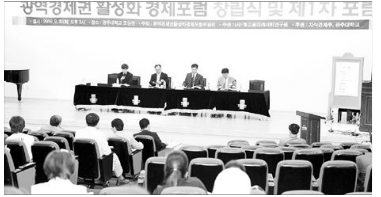
광역경제권 활성화 경제포럼 창립식 및 제1차 토론회에서 발제자들이 호남권 네트워크 구축전략 등에 대해 주제 발표하고 있다.

증가율 10.8%로 가장 높았고 지난 정부에서 높은 증가율을 보였던 보건, 복지분야는 73조7천억원으로 9%가 늘었다. 교육분야는 38조7천억원으로 8.8%, SOC는 21조1천억원으로 7.9%의 비교적 높은 증가율을 보였다. 이에 비해 통일·외교분야는 2조9천억원으로 2.2%, 문화·체육·관광은 3조4천억원으로 3.4% 늘어나는데 그쳤으며 일반공공행정분야는 공무원 정원과 임금 봉급에 따라 47조5천억원으로 3.5%의 낮은 증가율을 기록했다. /박지경기자 jkpark@kwangju.co.kr