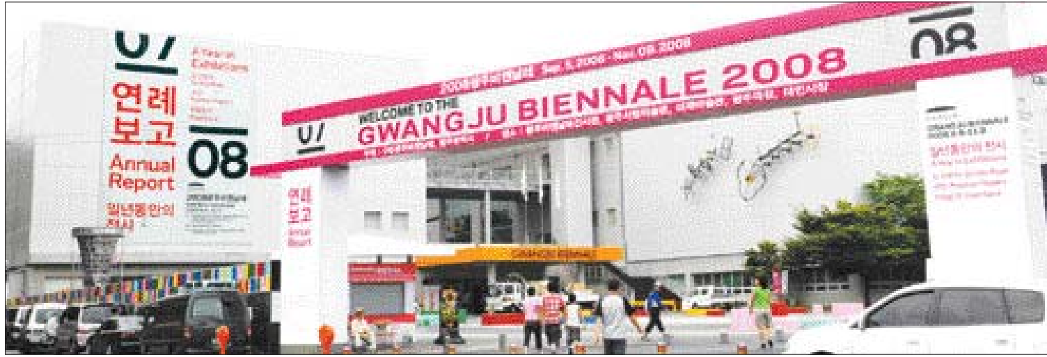
광주비엔날레 재단의 정책연구실이 열악한 대우 등의 이유로 적임자를 찾지 못해 신설이 지연되고 있다. 사진은 광주시 북구 중외공원내 비엔날레 전시관 전경.