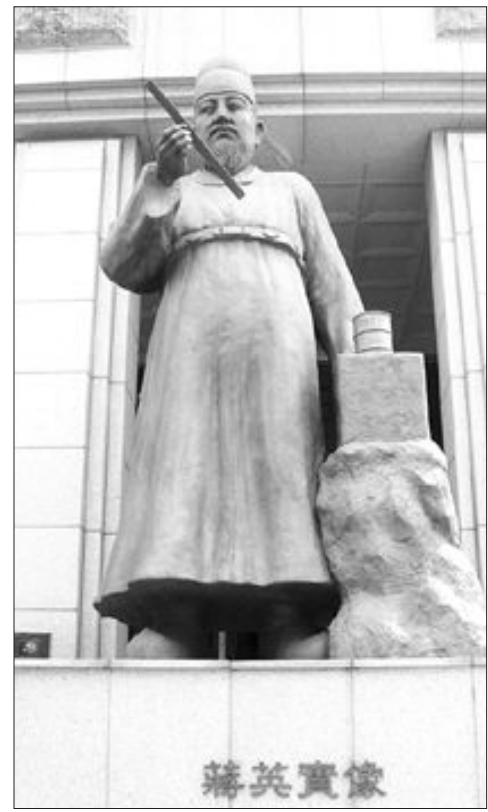
경기도 성남시 한국과학기술한림원 앞에 있는 장영실 동상.

'인생 승리'의 대표주자라고 할 수 있는 장영실(1383년 무렵~?)은 그는 중국인 아버지와 관비 출신 어머니 사이에서 태어난 혼혈아로 어려서부터 물건을 만드는 솜씨가 뛰어나 태종 때 공결의 공인(工人)이 됐다. 세종 때 천문기구인 혼천의를 만들어 노비에서 면천된 장영실은 이후 측우기, 해시계, 간의대, 규표 등 각종 과학기구를