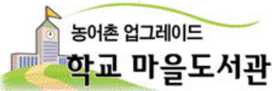
광주일보·(사)작은 도서관 만드는 사람들 전남도·전남도교육청·(주)NHN 공동 캠페인

각각 정착한 것으로 나타났다. 이에 대해 이 의원은 “이처럼 원주민 정착률이 저조한 것은 보상이 낮거나 분양가가 높아져서 재입주 여건이 안 되기 때문”이라고 풀이했다. 강 의원은 “원주민의 주거 복지를 위해 실시하고 있는 주거환경개선사업이 오히려 원주민을 내쫓는 주거박탈사업이 되고 있다”며 “주거환경개선사업의 목적을 충실히 수행할 수 있는 방안을 마련해야 할 것”이라고 지적했다. /박지경기자 jkpark@kwangju.co.kr