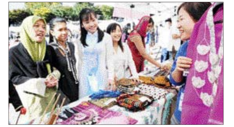
광주시가 ‘국제교류의 날’인 12일 조선대 1·8극장에서 광주에 사는 외국인 근로자, 유학생 등 외국인과 시민 1천명을 초청, ‘제14회 광주국제교류의 날’ 행사를 가졌다.