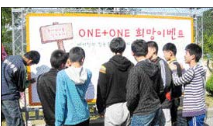
국민은행은 지난 14일 제89회 전국체전 핸드볼경기장인 목포대 실내체육관에서 핸드볼경기 후원행사인 'ONE+ONE 희망 이벤트'를 개최했다.