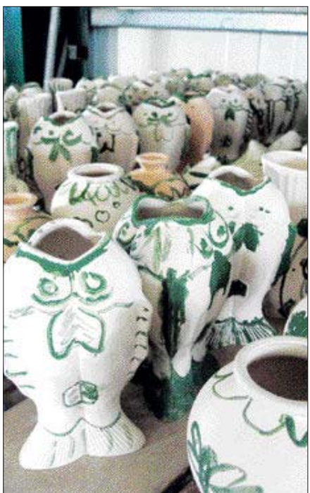
학생들이 초록색 물감을 사용해서 자유롭게 그림을 그려놓은 도자기들.