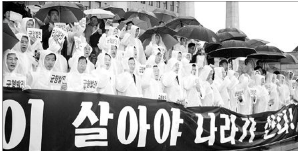
여야 의원 및 광역지방자치단체장들이 22일 국회 본청 계단에서 “국가균형발전이 대한민국 선진화의 첫걸음”이라며 “수도권 규제완화를 결사 반대한다”고 주장하고 있다.