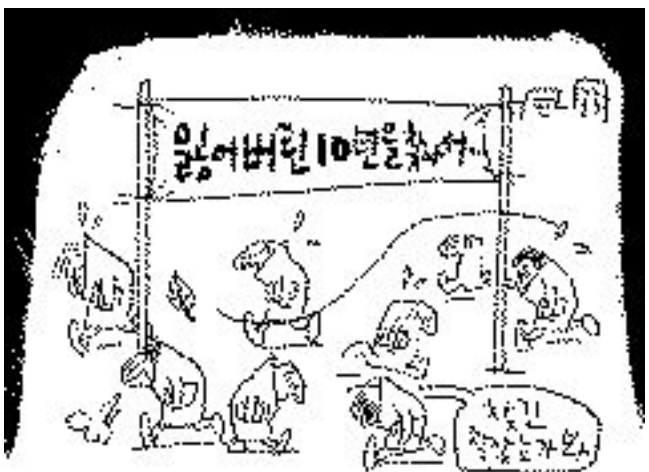
10년전 IMF시절(?)을... ?!