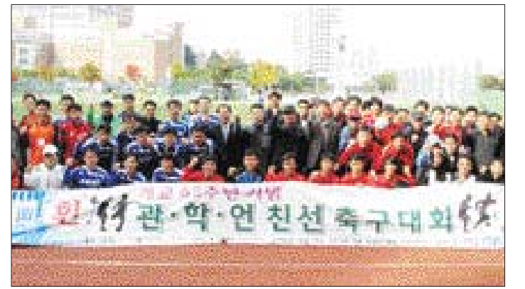
조선대 개교 62주년을 기념하는 관·학·언 친선 축구대회가 지난 25일 조선대 운동장에서 열렸다. 이날 행사에는 조선대 산학협력단, 전남도청, 완도군청, 광주·전남기자협회 등 4개팀이 참가했다.