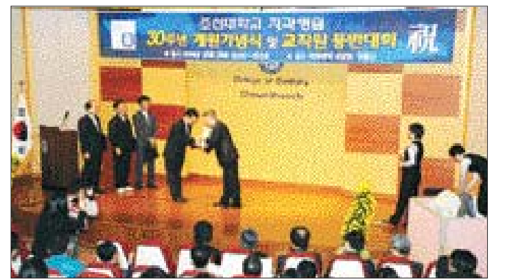
조선대 치과병원 ‘개원 30주년 기념행사’가 지난 25일 조선대 치의학전문대학원 1층 대강당에서 열렸다. 1978년 10월26일 개원한 조선대 치과병원은 그동안 900여명의 치과의를 배출했다.