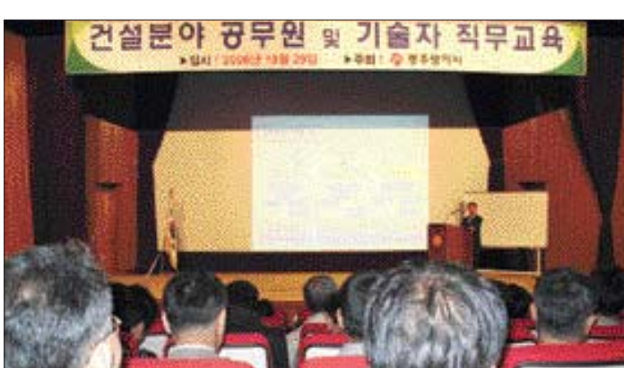
광주시는 29일 공무원교육원에서 기술직공무원과 대형건설공사 책임 감리원, 현장 기술자 등 400여명을 대상으로 '2008년 하반기 직무교육'을 실시했다.