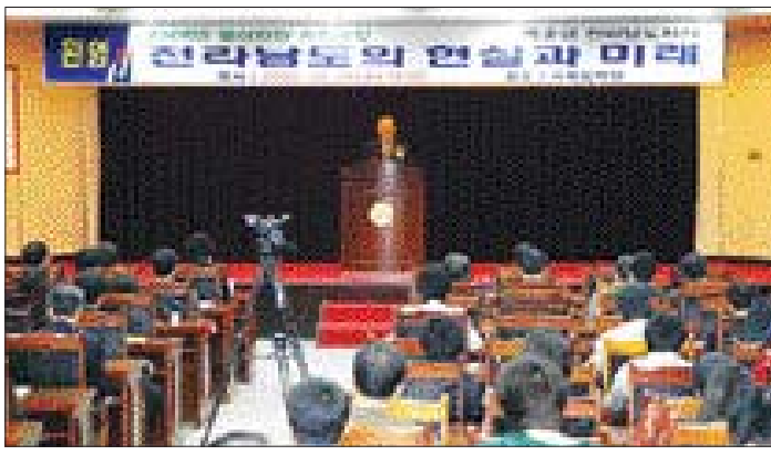
동신대학교(총장 정기언)는 29일 대학 국제회의장에서 박준영 전남도 지사를 초청, '전라남도의 현실과 미래'를 주제로 '동신연단 특강'을 개최했다.