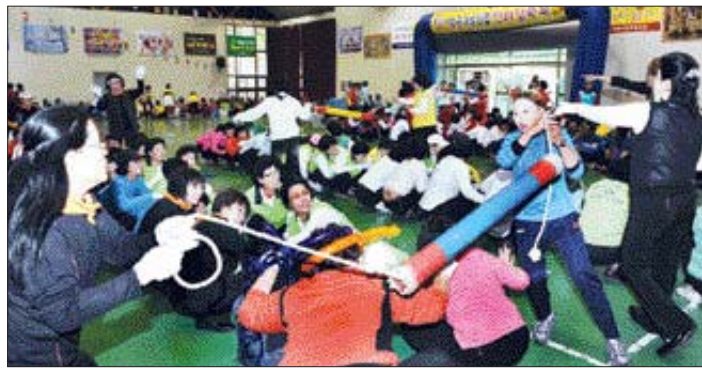
광주시 북구와 북구여성단체협의회는 6일 광주시 북구 매곡동 대한적십자사 실내체육관에서 여성단체 회원 400여명이 참여한 가운데 '제8회 북구 여성 화합 한마당' 행사를 가졌다.