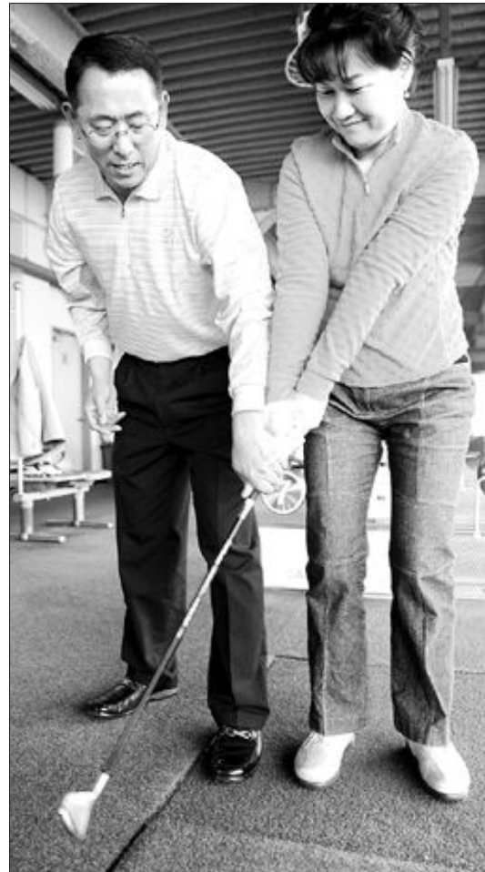
다운스윙에서 클럽헤드가 먼저 풀린 잘못된 동작(왼쪽)과 클럽 끝이 리드한 잘된 동작.

작은 만남 큰 기쁨 광주일보 친절한 서비스와 고객의 입장에서 모시겠습니다.