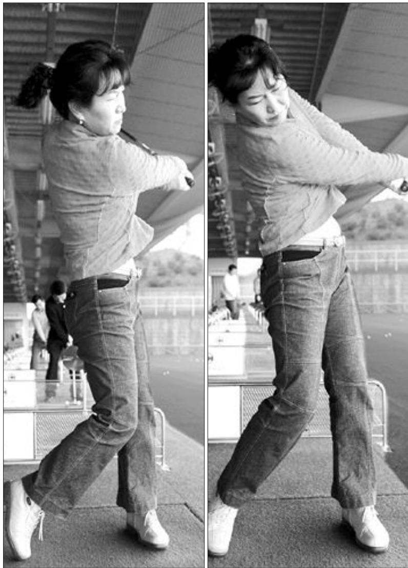
다운 스윙에서 머리와 우측 어깨가 타깃 방향으로 움직인 잘못된 동작(왼쪽)과 머리가 공 뒤쪽에 위치하고 우측 어깨가 열리지 않은 잘된 동작.