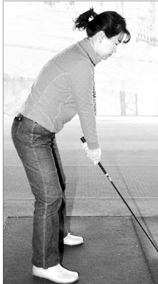
등이 굽은 잘못된 어드레스(왼쪽)와 등이 곧게 펴진 올바른 어드레스.