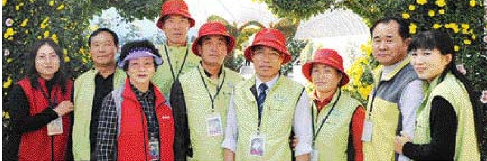
함평군 자연생태공원에서 열리고 있는 '2008 대한민국 국화대전'에서 자원봉사자로 활동하고 있는 대한민국 국화동호회 회원들. 회원들은 국화 가꾸는 재미가 쏠쏠하다고 입을 모은다.