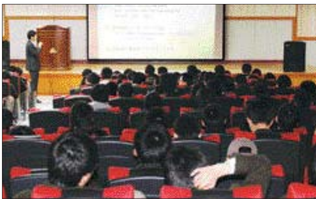
광주·전남지방병무청(청장 손종혜)은 17일 광주 진흥고에서 수능시험을 마친 3학년 수험생들을 대상으로 '병무행정 설명회'를 가졌다. 이 설명회는 다음달 4일까지 고교를 순회하며 실시된다.