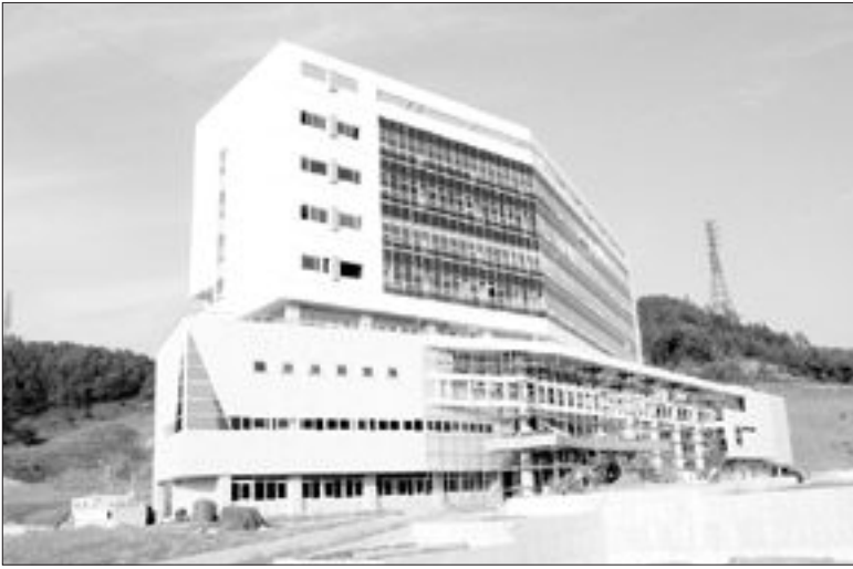
무안군 삼향면 남악신도시에 조성중인 전남도교육청 신청사가 18일 현재 90%의 공정율을 보이고 있다.

특히 신청사는 건물 공간을 단순히 활용하는 것을 넘어 첨단 정보통신, 발달자동차, 사무자동화 등 각 분야의 시스템을 통합한 한 지능형빌딩시스템(Intelligent Building System·IBS)으로 설계된 업무효율을 극대화