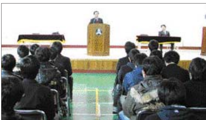
광주남부경찰서 윤재문 서장은 19일 오전 광주시 남구 백운동 석산고등학교에서 수능을 마친 고3 수험생을 상대로 '꿈을 꿀 수 있다면 이를 할 수 있다'는 주제로 강연을 했다.