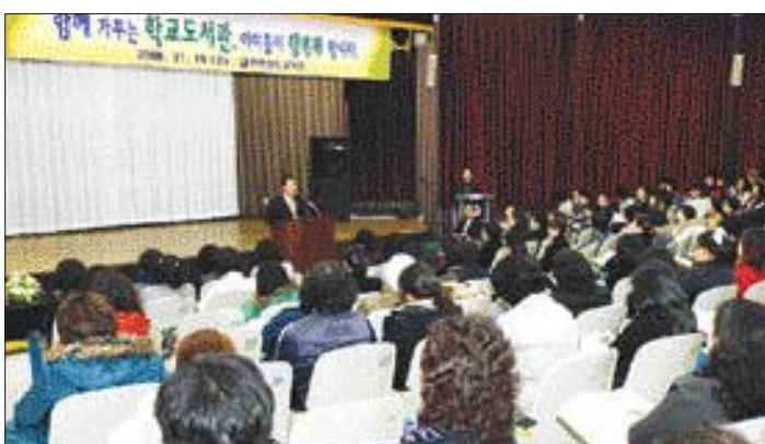
전남도교육청(교육감 김창환)은 최근 전남도교육연구원에서 초·중·고 학부모 독서 도우미 300여명을 초청해 '함께 가꾸는 학교도서관, 아이들 행복해 합니다'라는 주제로 연찬회를 실시했다.