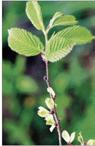
플라보노이드, 사포닌 성분이 풍부한 느릅나무는 알레르기성 비염 치료를 돕는 웰빙 식품이다. 느릅나무 껍질(왼쪽)과 느릅나무 잎.