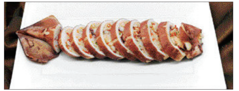
▲느릅나무 육수 오징어순대=①오징어의 내장을 빼고 다리는 잘게 썰어 양파, 고추, 마늘, 느릅나무 우리물로 지은 찹쌀밥과 함께 썩는다. ②순대를 삶고 꼬치로 고정시켜 김으로 찜기 20분정도 찜 다음 초간장과 곁들여낸다.

하므로 종기나 종창에 신기한 효과가 있는 약나무다. 부스럼이나 종기가 난 데에 송진과 느릅나무 뿌리껍질을 같은 양씩 넣고 물이 나도록 짓찧어 불이 면 놀라울 만큼 잘 낫는다. 느릅나무 뿌리껍질을 물에 담가 두면 끈적끈적한 진이 많이 생기는데 그 진을 먹거나 바르면 피부가 부드러워진다. 죽염을 섞어 피부에 바르면 각종 피부질환을 치료하고 피부부를 아름답고 매끄럽게 하는 데 신기한 효과가 있다. /오광복기자 kroh@kwangju.co.kr