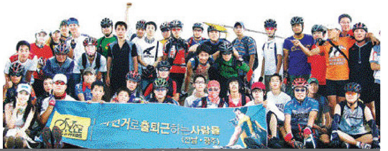
▲매달 한차례씩 모여 친목을 도모하고 있는 자출사 동호인들.