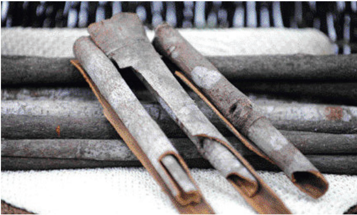
계피는 당뇨병을 예방하고, 입 냄새를 없애주는 효능이 있다.

싸한 맛도 계피가 낸다. 계피는 단 음식에 넣으면 단맛을 더 높인다. 설탕이 든 케이크, 푸딩, 쿠키나 사과잼에 계피 분말을 뿌리는 것도 단맛을 살려주기 때문이다. 계피는 중세 유럽에서 가장 비싼 물품이었다고 한다. 당시에는 계피를 약재용 저울에 달아서 그 값어치를 측정했는데, 화폐기능까지 담당해서 계피로 세금을 치르기도 했다고 한다. 계피의 중 성분은 정유(계피알데하이드, 신나밀알데하이드 등) 1~3.4%, 탄닌질 2~3%, 점액, 탄수화물 등이다. 계피나무의 가지에도 정유가 있으며, 5~6년 자란 나무에서 정유함량이 가장 높다. 최근 연구를 통해 계피가 당뇨병을 예방·치료하는 것으로 밝혀지고 있다. 캘리포니아 주립대학교, 아이오와 주립대학교 농학과의 공동 연구결과 계피 자체가 인슐린 유사 활성(insulin-like activity)을 가지고 있고, 인슐린의 작용을 증가시킬 수 있는 것으로 드러났다. 계피는 당뇨병을 치료하거나 예방할 가능성을 가진 생활성 성분이라는 것이다. 또 미국 농부성도 최근에 파키스탄에서 계피를 사용한 임상 시험을