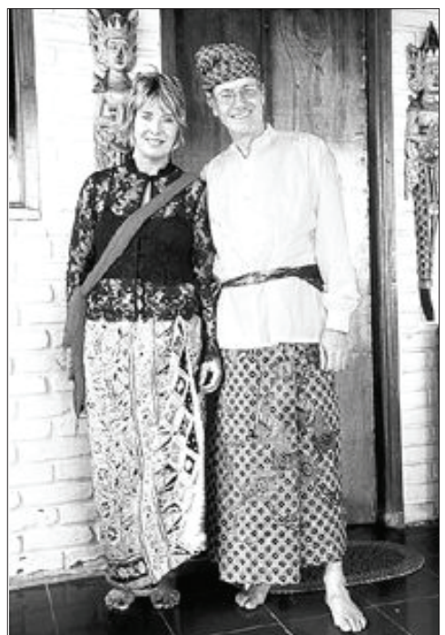
2003년 결혼 25주년 기념일을 맞아 발리 여행 중 전통 의상을 입고 찍은 사진. 오른쪽이 토니 힐러씨다

전 세계에서 500종이 넘는 여행 책을 발간해 700만부 이상 판매하는 세계 최대 여행 전문 출판사 '론리 플래닛'(Lonely Planet). 책은 '론리 플래닛 시리즈'를 만든 토니와 모린 힐러 부부의 인생과 비즈니스, 그리고 여행담을 담고 있다.