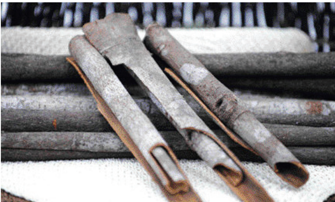
계피는 당뇨병을 예방하고, 입 냄새를 없애주는 효능이 있다.

위 점막 자극·腸 운동 촉진, 소화 도와 머리 맑아져 두통 해소...감기에도 좋아