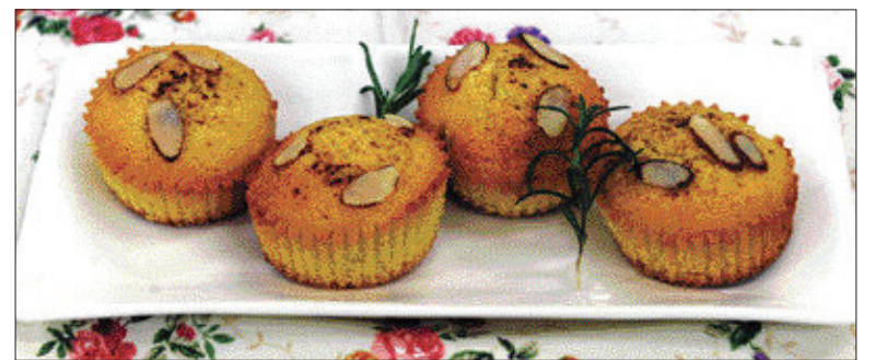
▶계피 머핀=①버터를 부드럽게 만든 다음 설탕을 넣고 계란을 섞는다. 체진 밀가루, 베이킹파우더, 계피 가루를 넣고 우유로 농도를 조절하면서 반죽한다. ②머핀컵에 80%정도 반죽을 채우고 슬라이스 아몬드를 뿌리고 180도 오븐에서 20분 구워낸다.

▶계피 매실 피클 =①소금물에 삭혀둔 매실을 헹구 물기를 뺀다. ②식초, 설탕, 막대 계피, 통후추, 오이, 홍고추, 월계수잎을 넣어 2주 정도 두었다가 먹는다.