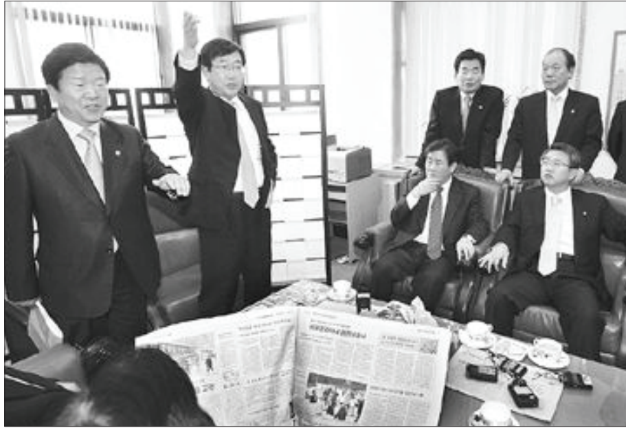
8일 오후 여의도 국회 기획재정위원회사무실을 찾은 민주당 교육위원회 의원들이 재정위원회의 교육세법 폐지 안건과 관련해 교육위 심의 후 처리 등을 요구하고 있다.

육재정 교부율을 정부안 20.4%보다 올려 교육세 폐지에 따른 교육재정 악화 가능성을 사전에 차단하는 만큼 문제가 없다는 입장이다.