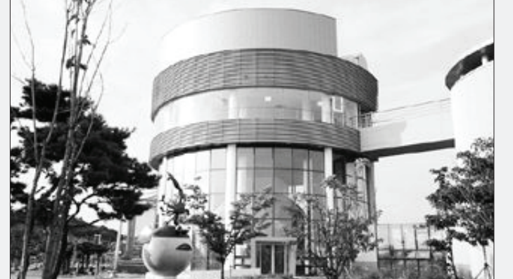
'낮에는 새 보고 밤에는 별 보는' 국내 첫 평지 천문대

유물 기증자에게는 기증서를 수여하고 기증자 전용 전시공간 제공과 함께 한국차박물관 무료입장 등 다양한 혜택이 주어진다. /보성=선성근기자 sun@