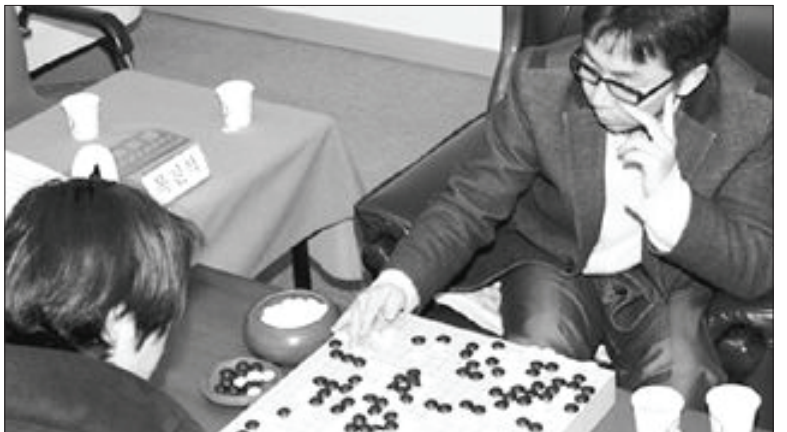
목진석 9단이 지난 10일 서울 한국기원 4층 특별대국실에서 열린 제52기 국수전 도전 5번기 3국에서 이세돌 9단을 196수 끝에 불계로 물리쳤다.