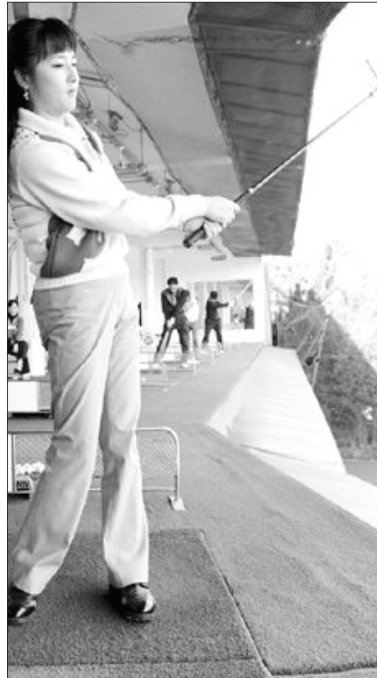
공을 퍼올리는 잘못된 어프로치(왼쪽)와 클럽 페이스가 타격을 향하고 있는 잘못된 어프로치.