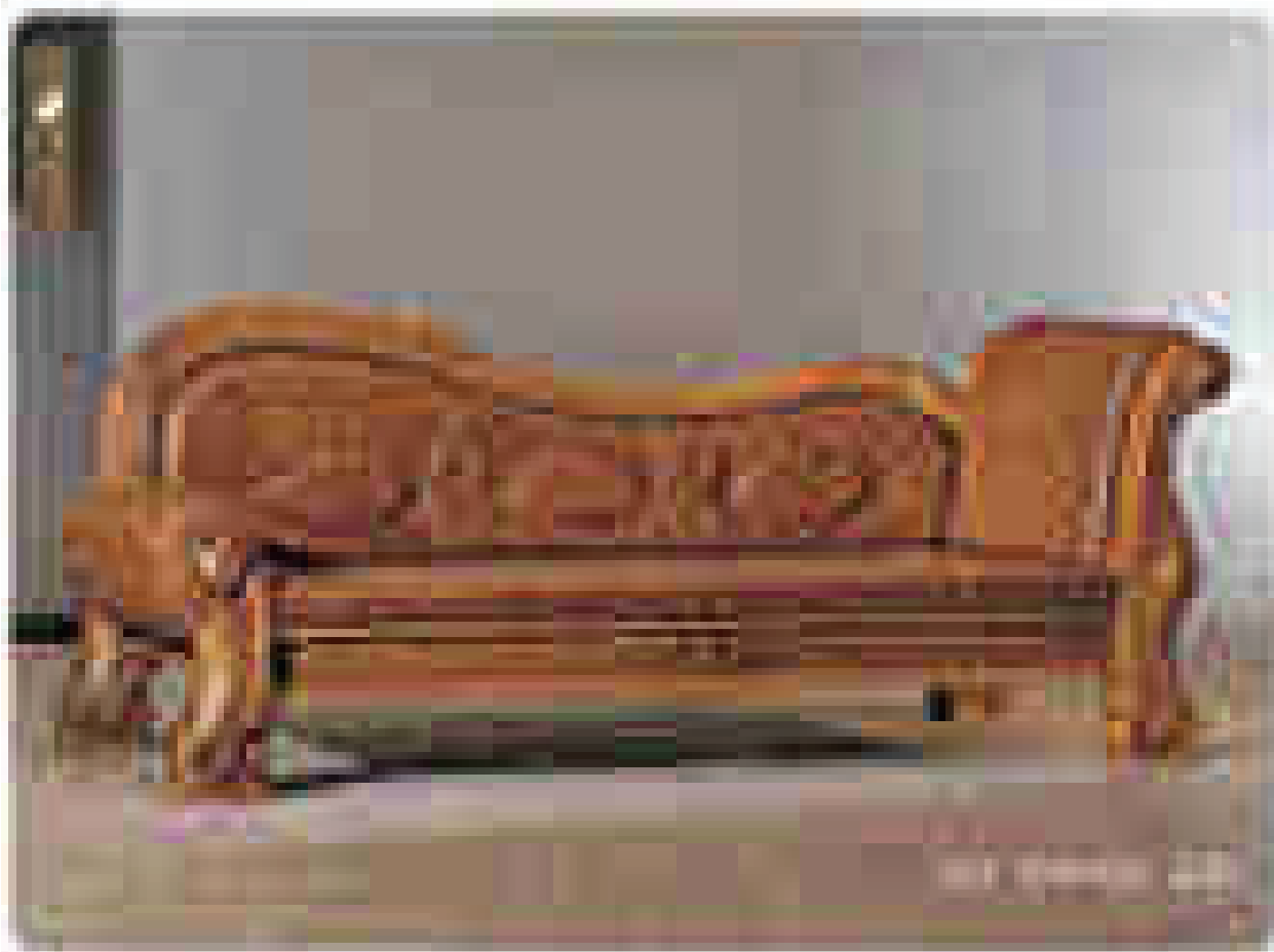
DHD 725 황도출, 선유합판식 (2프 소파) ₩ 2,280,000