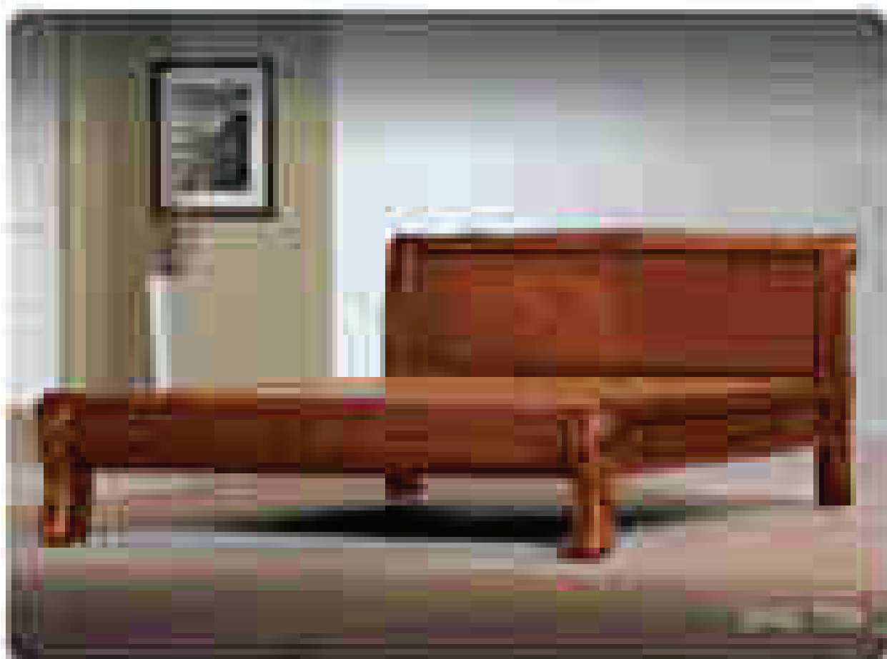
DHD 301 칠보석·황도출, 무늬목합판식 (2프 침대) ₩ 2,990,000

기간: 2008년 12월 13일(토) ~ 15일(월) 3일간 장소: 광주 신세계백화점 지하 1층 행사장 전화: (062)360-1461/011-229-3970