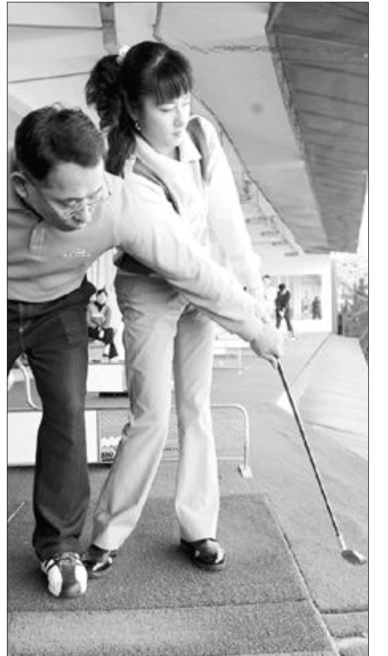
공을 퍼올리는 잘못된 어프로치(왼쪽)와 클럽 페이스가 타격을 향하고 있는 잘못된 어프로치.