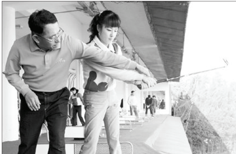
공을 때린 후 왼팔을 쭉 펴서 클럽을 내미는 잘못된 동작(왼쪽)과 공을 때린 후 왼팔이 접혀져야 하는 동작.

나 씨의 경우 드라이버 테이크 백에서 체중이 왼발에 남아 있기 때문에 역시 퍼올리는 스윙이 된다고 말했다.