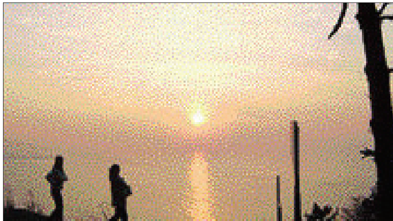
영광 백수 해안도로 일몰