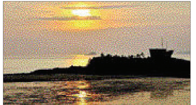
신안 증도 방축리 해안 일몰