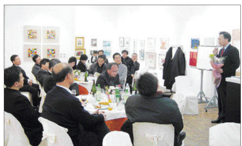
광주지역 친목단체인 한울회 회원들이 시안갤러리에서 작품을 감상하며 송년회를 즐기고 있는 모습. <시안갤러리 제공>

“갤러리에서 송년회 보내세요” 시안갤러리(광주 서북구 매곡동 박마트내)가 송년 모임을 여는 단체에게 무료로 전시장을 개방한다. 시안갤러리는 오는 31일까지 전시장에서 미술작품을 감상하면서 전문가들로부터 미술 강의도 들을 수 있는 송년회 장소 대여를 해주고 있다. 20인 이상 단체는 누구나 신청 가능하며, 개인당 1만원의 식비를 내면 저녁 식사도 함께 제공된다.