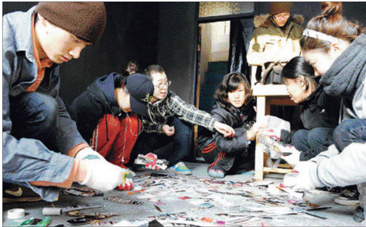
17일 조선평 미술대학 학생들이 광주시 동구 대인시장의 빈 점포에서 벽면에 설치할 작품을 그리고 있다.

한때 호황을 누렸던 '대인사택소'였던 이곳은 주고객이었던 상인들이 떠나면서 가장 먼저 문을 닫았다. 이날 색칠을 마친 대학생들은 세탁소 벽에 철제 옷걸이를 이용한 설치 작품을 내놓았다. 바쁘게 손을 움직였다. 인근 점포의 상인들도 이들 대학생들의 작업 모습이 낯설지 않은 듯 세탁소 주변을 맴돌며 격려를 아끼지 않았다. 상인들은 대인시장을 무대로 한 2008 광주비엔날레 '복닥방 프로젝트'를 통해 이미 작가들을 가까이 지켜봤던 경험이 있던 탓인지 학생들의 작업에 남다른 관심을 보였다.