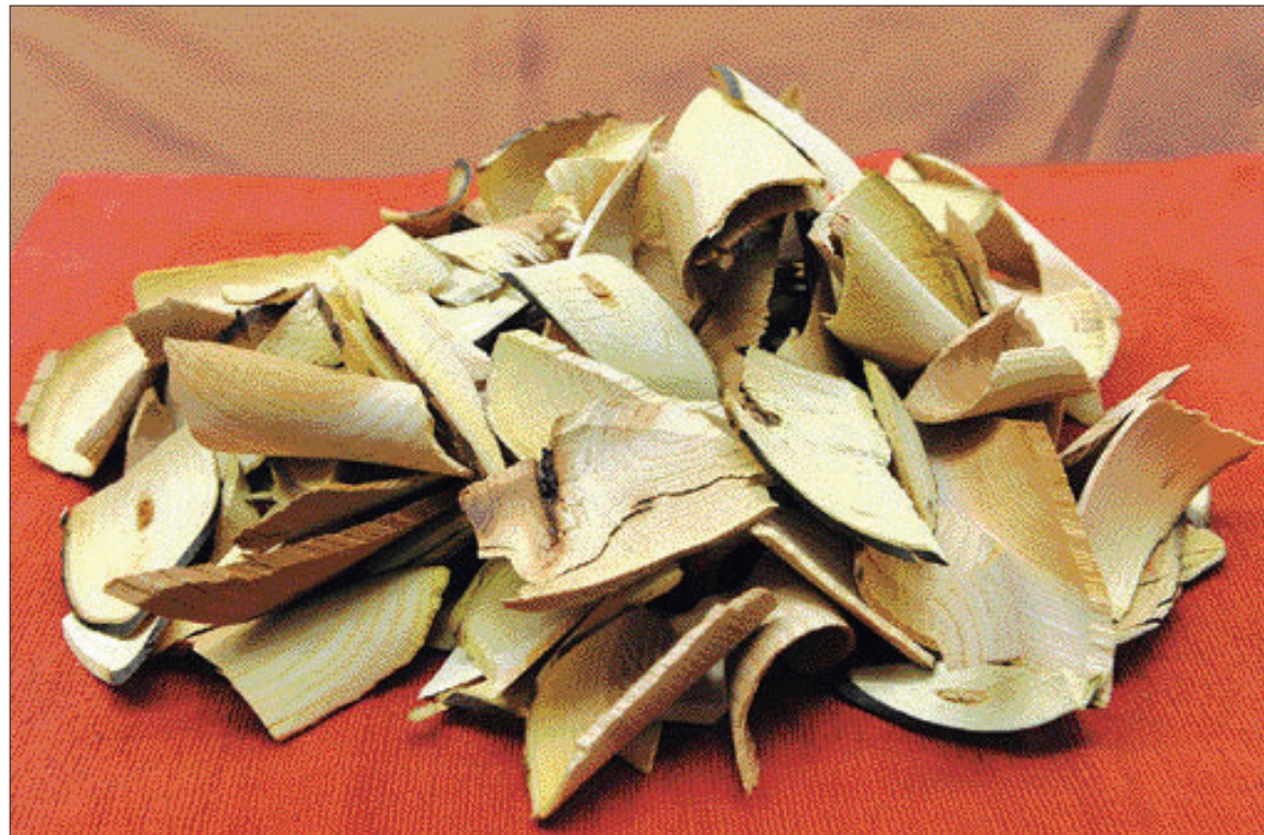
갈슘, 비타민C 등이 다량 함유돼 있는 헛개나무는 간을 보호하고, 각종 성인병을 예방해주는 효능이 있다.

간이 나빠져 간기능 검사를 받으면 흔히 간수치가 높다는 말을 듣게 된다. 이것은 간세포에 들어있는 혈