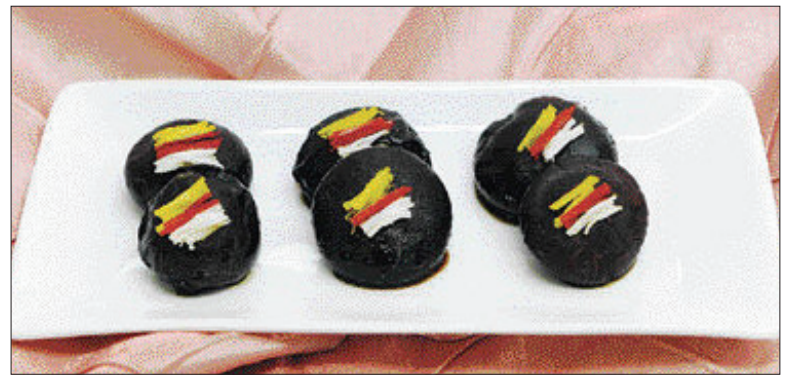
▲헛개나무 표고버섯 장조림=①간장, 북어, 양파, 마늘, 대파, 다시마, 헛개나무를 찬물에 넣고 끓이다가 면보에 받친다. ②①에 간장, 설탕, 생강, 후춧가루, 물엿을 넣어 조린 다음, 하룻밤 불린 건표고버섯을 넣어 증불에서 조린다. ③접시에 담고 황·백지단과 흥고추채를 얹어낸다.