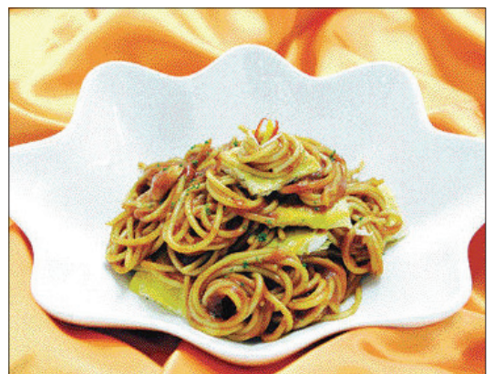
▶헛개나무 생선 스파게티=①흰살 생선은 밀가루와 계란 노른자를 묻혀 기름 두른 팬에 지진다. ②팬에 올리브유를 두르고 다진 마늘을 볶다가 케첩과 헛개나무 우린물을 넣고 설탕과 후춧가루 넣는다. ③토마토소스를 끓이다가 삶은 스파게티 면을 넣고 섞은 다음, 그릇에 담고 파슬리가루 뿌려낸다.