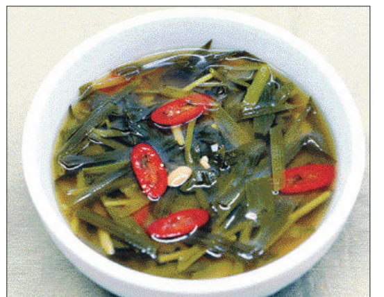
▶헛개나무 보리 된장국=①헛개나무 삶은 물에 된장을 풀고 살짝 데친 보리순을 넣어 끓이다가 멸치가루와 마늘, 국간장으로 간을 하고 흥고추를 얹어 낸다.