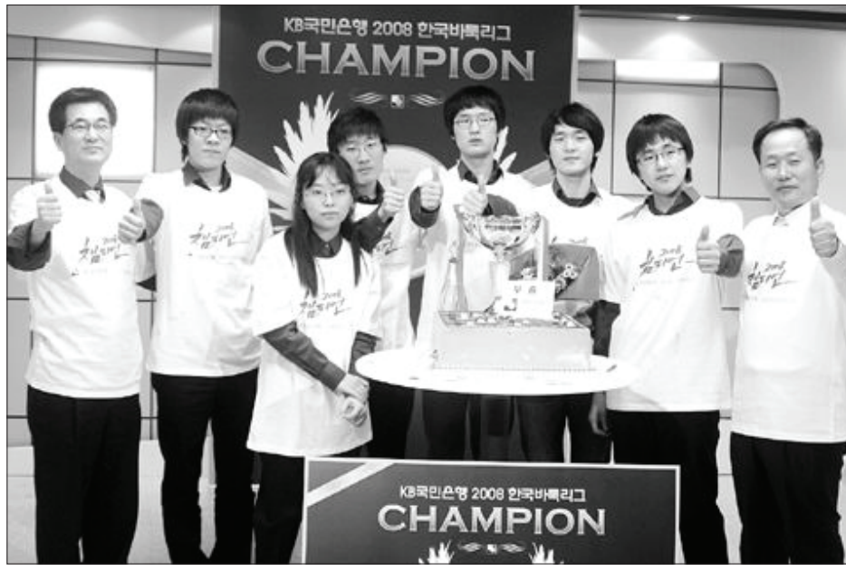
영남일보가 KB국민은행 2008한국바둑리그에서 우승, 2연패를 달성했다.

우승팀 영남일보는 2억7천만원의 우승수금을 받으며, 2위를 차지한 신성건설은 1억6