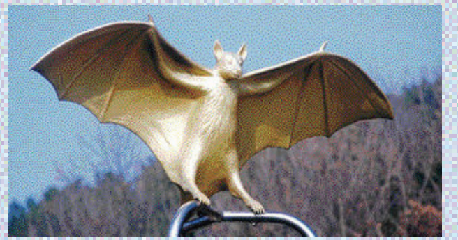
1999년 '황금박쥐' 발견... 생태지역 지정

고산동 마을은 지난 1999년 동네 뒷산인 고산봉에서 '황금박쥐'(학명 붉은박쥐)가 발견돼 널리 알려진 곳이다. 그래서 생태보전 지역으로 지정돼 있어 주민들은 농약을 전혀 사용하지 않는 친환경 농법을 고집하고, 박씨는 동네 사람에게서 쌀·찹쌀은 물론 콩·녹두, 고추·깨 등을 음식재료로 구입해 사용한다. 박씨는 "함평을 '제 2의 고향'으로 여기고 뿌리를 내리겠다"며 "앞으로 청주와 된장을 지역명물로 만들어가고 싶다"고 말했다. 문의(061-324-9005) /글·사진=송기동기자 song@ /함평=박영진기자 pyj4079@