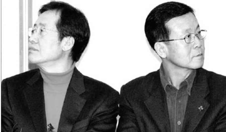
타결 혹은 전쟁? 김형오 국회의장이 민생법안을 우선 처리하고 민주당의 본회의 장 점거의 조건없는 중단을 요구한 가운데 29일 국회에서 열린 3당 원내대표 회담에서 한나라당 홍준표 원내대표와 민주당 원혜영 원내대표가 대화를 나누다 이내 시선을 달리하고 있다.

쟁점 법안들을 놓고 '연내 강행 처리'와 '결사 저지'로 버텨 끝 대치를 벌여온 여야가 29일 국회 정상화를 위한 협상에 나섰으나 현격한 입장차로 난항을 겪었다. 한나라당 홍준표, 민주당 원혜영, 선진과 창조모임의 권선택 원내대표 등 3개 교섭단체 원내대표는 이날 오후 5시와 9시에 각각 만나 민주당과 선진창조모임이 합의한 '국회정상화 방안'을 놓고 협상을 벌였다. 하지만, 한나라당은 기존에 제시한 85개 법안 중 사회개혁법안 13개는 합의처리하되 경제살리기 법안을 포함, 나머지 72건의 경우 연내 처리하지는 않겠다고 고수한 반면 민주당은 "방송법 등 악법 철폐 없이는 수용할 수 없다"고 맞서면서 진통을 겪었다. 홍 원내대표는 "사회개혁법안 합의처리를 놓고 내부 반발이 많았지만 원만하게 국회를 이끌기 위해 양보한 것"이라고 말한 반면, 원 원내대표는 "13개 법안 빼고 미디어 관련법 등을 이번엔 모두 처리하지는 게 한나라당 입장으로 결코 받아들일 수 없다"고 말했다. 민주당과 선진창조모임이 이날 김형오 국회의장의 '중재안' 발표 후 합의한 정상화 방안은 내년 1월8일 종료되는 임시국회 회기 중 여야가 합의가능한 민생법안만을 처리한다는 내용을 골자로 하고 있다. 이 방안은 ▲한나라당의 예산안 및 한미 FTA(자유무역협정) 비준안 강행처리 사과 및 민주당의 국회 점거 농성사태 사과 ▲한나라당과 국회의장의 임시국회 중 직권상정 방침 철회 및 민주당의 분회의장 등 농성 해제 ▲임시국회 회기 중 정부제출법안 등 긴급처리 대상 법률안 중 이견이 없는 법안 합의 처리 등도 담았다. 이에 앞서 김 의장은 이날 오전 롯데호텔에서 기자회견을 갖고 쟁점법안의 처리사항