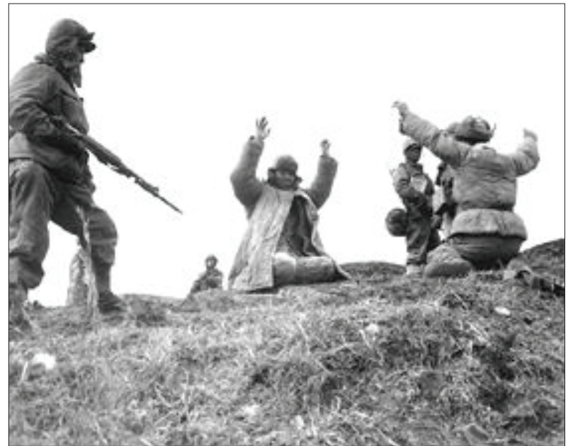
6·25전쟁 당시 미군 사진가들이 찍은 사진 150여장을 주한 미군 기지관리사령부 (IMCOM-K)가 미 국방부 자료실로부터 입수해 온라인 사진 공유 커뮤니티 사이트 플리커닷컴(http://www.flickr.com)을 통해 일반에 공개했다. 1951년 한국전쟁 당시 UN 공수부대원들의 낙하 모습(사진 왼쪽)과 1951년 3월 2일 강원도 횡성에서 중국군 포로를 붙잡고 있는 미 해병 1사단 장병들. /연합뉴스