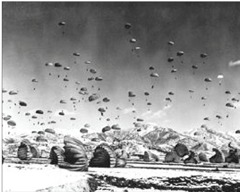
낙하·포로 감시 ... 한국전쟁 당시 사진들

높음을 내비쳤다. 이와 함께 농림식품부는 한식 세계화 추진을 위해 한식 전문교육기관 지정을 통한 정예 조리인력을 육성하고, 한식당의 해외진출 확대에 필요한 초기 정착자금 20억원을 지원할 계획이다. 특히 오는 6월까지 해외 한식당 인증모델을 개발해 올 하반기부터 시범 인증제를 도입할 예정이다. 정 본부장은 "한식 세계화에 전남도가 많은 관심을 가지고 있다"면서 "전남도에 적극 협력하겠다" 밝혔다. /최권일기자 cki@kwangju.co.kr