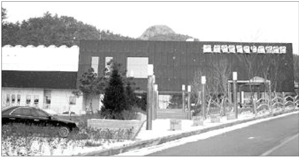
'무안군립오승우미술관'이 명칭 문제를 둘러싸고 개관에 차질을 빚고 있다. 미술관 전경.

한국 인상주의의 선구자인 오지호(1905~1982) 화백의 장남이다. 십장생도, 산, 절 등 한국적인 것들에 애정을 쏟고 있다. 국전 4회 특선, 국전 추천작가 등을 역임했으며 현재 대한민국 예술회 회원이다.