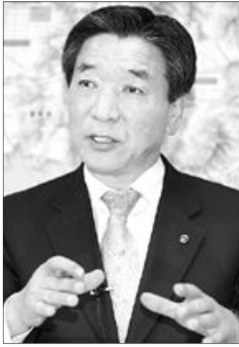
조사료 재배면적을 확대하는 한편 유자 부산물을 이용한 한우 비육우 사료도 개발해 나갈 계획이다.

고흥의 근간산업인 농수축산업 분야의 경우 친환경 생산·가공시설의 현대화, 체계적인 유통마케팅 도입, 판로개척 등으로 소득증대에 나선다. 특히 한우특성화사업과 송아지인양제 지원사업 등을 적극 추진해 축산물 품질 고급화를 앞당기고,