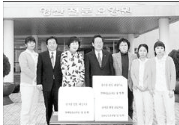
전남도교육청(교육감 김장환)은 설을 앞둔 20일 사회복지시설인 화순 영산노인전문요양원을 방문, 위문품을 전달하고 격려했다.