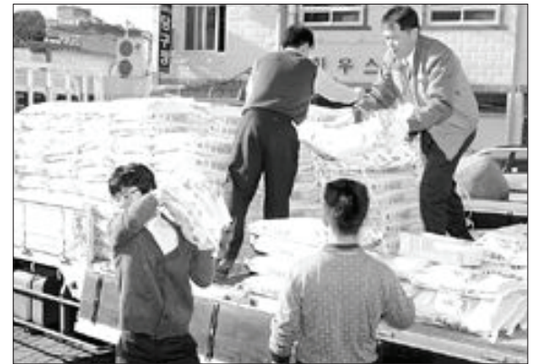
광양제철소(소장 허남식)는 설을 앞둔 20일 쌀과 라면·통조림 등 생필품을 광양지역 16개 사회복지시설, 노인정 등에 전달했다.