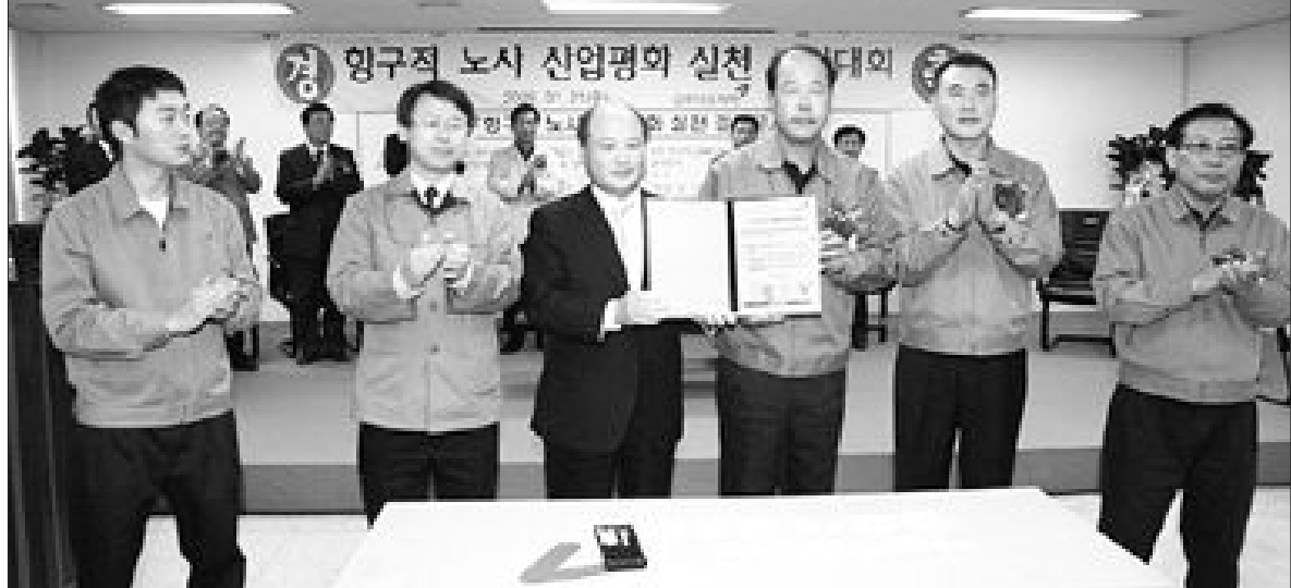
금호석유화학 노사 '산업평화 선언' 금호석유화학 가족 시장과 노조대표들이 21일 여수 고무공장에서 '항구적 노사 산업평화 실천 결의대회'를 갖고 2009년 임금을 동결하기로 선언하고 있다.

정무원 SK텔레콤 사장은 21일 KT-KTF 합병 계획에 대해 "덤집 부풀리기를 통한 거대 독점적인 사업자가 되겠다는 것"이라며 "위험한 발상"이라고 말했다.