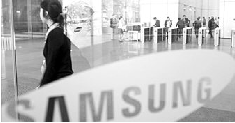
삼성전자가 지난해 4분기 글로벌 경기 침체 심화로 9천400억원의 영업손실을 기록했다. 사진은 삼성전자 강남 사옥.