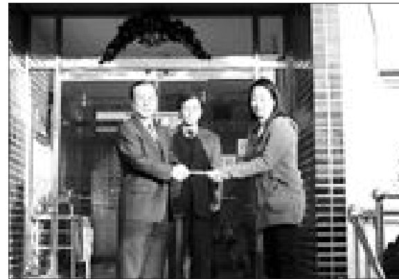
광주상공회의소 회원일동은 22일 설 명절을 앞두고 관내 아동보호시설인 광주일맥원과 양로원인 이일성로원을 찾아 위문품을 전달하고 위로 격려했다.