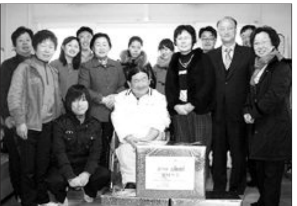
국립5·18민주묘지(소장 김명환) 직원 15명은 지난 22일 광주시 북구 각화동 '장애인공동체 즐거운 집'을 방문해 위문금과 위문품을 전달했다.