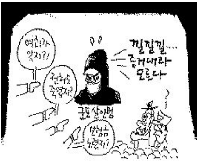
'고문기술자'에게 맡기고 싶은 심정