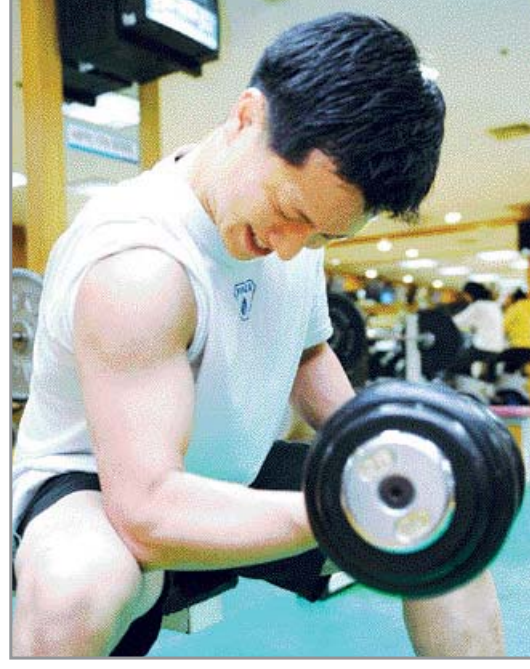
건강한 육체 건전한 의식