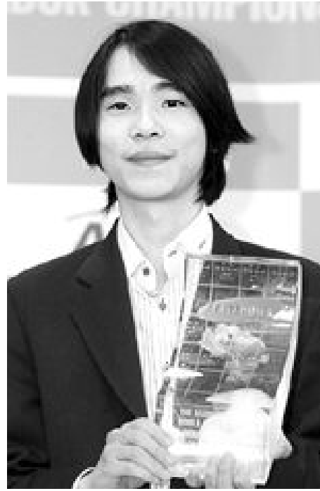
이세돌이 지난 21일 서울 삼성화재 본사에서 열린 제13회 삼성화재배 세계바둑오픈 결승에서 우승했다.

올해에는 이세돌이 천적 이창호의 강한 도전을 물리치는 등 자신의 부족한 2%를 극복하고 세계 최정상 자리를 지켜나갈지 관심이 쏠리고 있다. /오광록기자 kroh@kwangju.co.kr